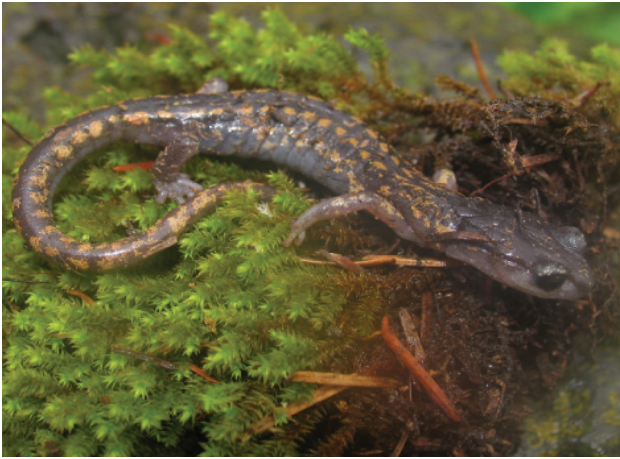
Figura 1. Ejemplar en vida de Pseudoeurycea melanomolga (MZFC 17723).

municipio de Chignautla, en la sierra Norte de Puebla, México (MZFC 17723; 19.7127° N 97.4749° O) a 2 807 m de elevación. Un mes después, el 28 de agosto del 2005, se observaron 3 crías de esta especie bajo una roca, en un bosque de pino de la misma localidad (MZFC-ID 1608 [imagen digitalizada]; 19.7134° N 97.4771° O), a 2 750 m de elevación. Estos registros extienden el área de distribución de P. melanomolga , aproximadamente 30 km (en línea recta) al NO de la localidad más cercana, Cofre de Perote, Veracruz (Parra-Olea et al., 2001) y representan el primer registro para el estado de Puebla.